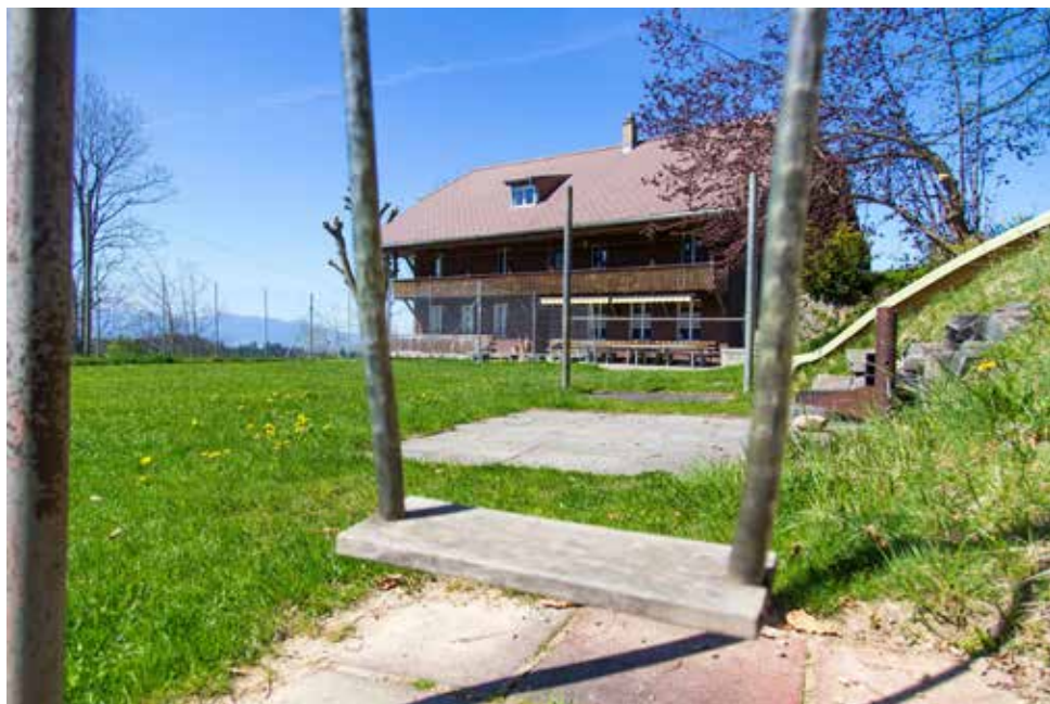
Ferienheim Honegg