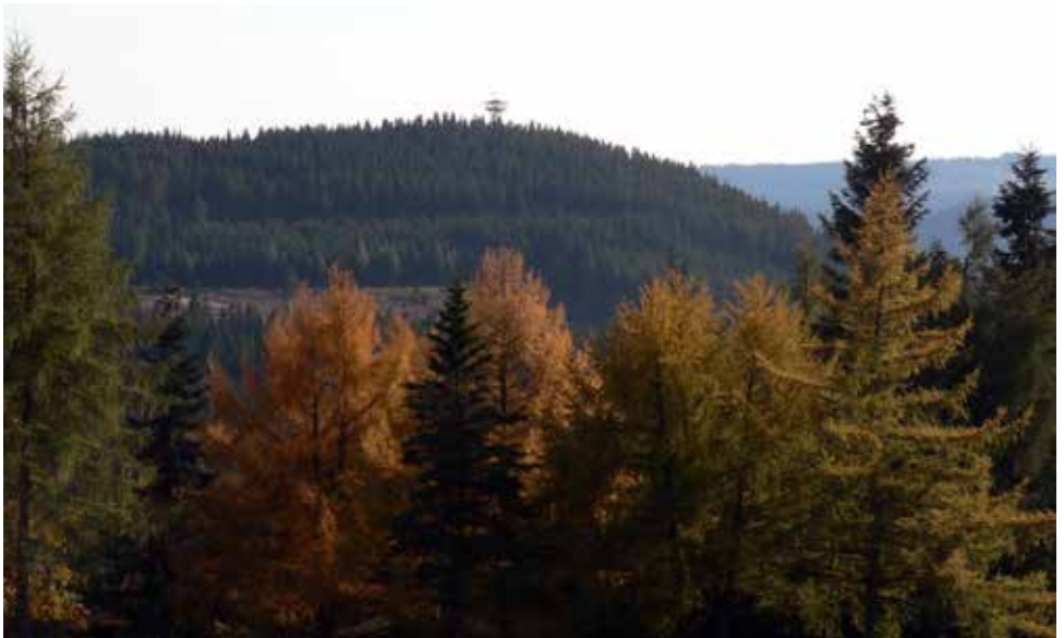
Herbstlich gestimmt