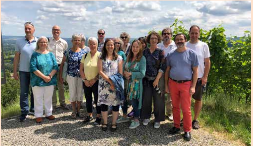
Unterwegs in Buchberg