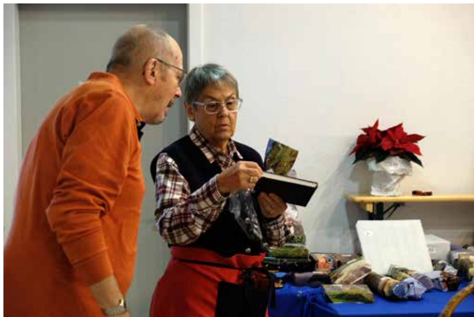
Kritische Prüfung des Sortiments